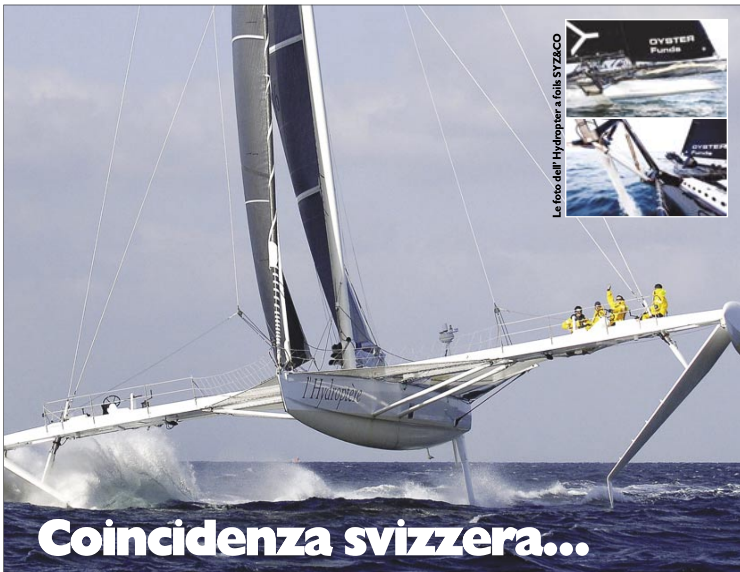
Le foto dell'Hydropter a foils SYZ&CO

anno 5° n. 89 quindicinale 15 aprile 2009 2,00 euro