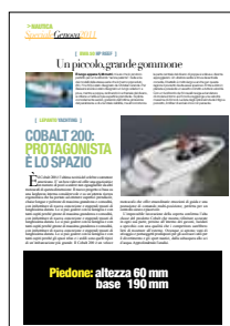
PIEDONE Altezza: 70 mm Base: 190 mm