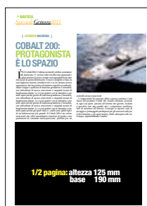
MEZZA PAGINA Altezza: 125 mm Base: 190 mm