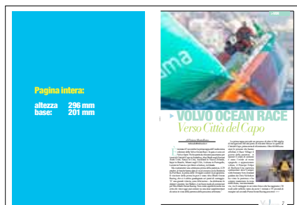
PAGINA INTERA Altezza: 296 mm Base: 201 mm