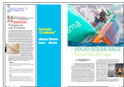
FORMATO 2 COLONNE Altezza: 293 mm Base: 86 mm